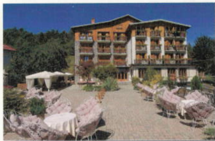
Piemonte L'Hotel Miramonti di Frabosa Soprana (Cn)